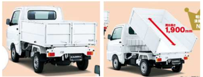
納入予定車 スズキキャリー清掃ダンプ

そこでお願いです。現在の軽ラダンプの管理状況を教訓に、新車・旧車ともに次のとおりの使用管理を行います。センターいわゆる会員みんなの財産ですので、適正な使用管理で大事に使い、長持ちさせたいと思いますので、必ず守っての使用をお願いします。