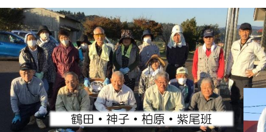
鶴田・神子・柏原・紫尾班