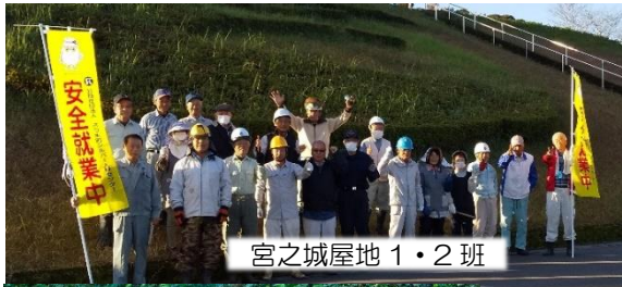
宮之城屋地 1・2 班

参加された会員の皆さん、大変ご苦労様でした。地域社会への貢献度を写真でたっぷりご覧ください。