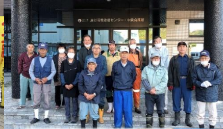
求名・中津川・永野班