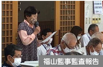
福山監事監査報告