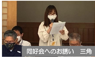
同好会へのお誘い 三角