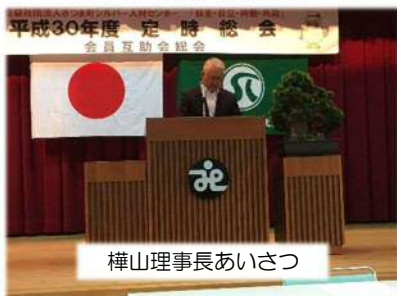
榊山理事長あいさつ

5月26日(土)、宮之城ひまわり館で平成30年度定時総会と会員互助会の総会を開催しました。あいにくの雨天で足元の悪い中でしたが、出席者は139人(会員総数275人中51%)、委任状提出者98人、議決権総数は237人で、いずれの数も近年では一番の数値を確保して開催しました。