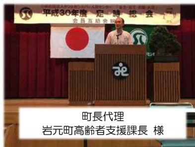
町長代理 岩元町高齢者支援課長 様