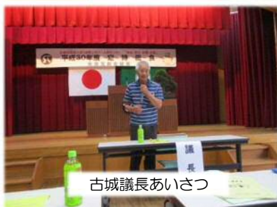
古城議長あいさつ