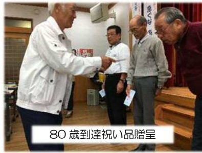
80歳到達祝い品贈呈