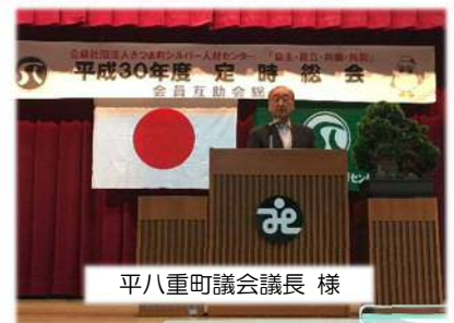
平八重町議会議員 様