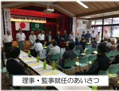
理事・監事就任のあいさつ