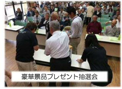
豪華景品プレゼント抽選会