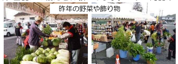
昨年の野菜や飾り物

商品は、26日(水)までに事務所に入れ込んでいただくか、ご連絡いただければ職員が収集に伺います。