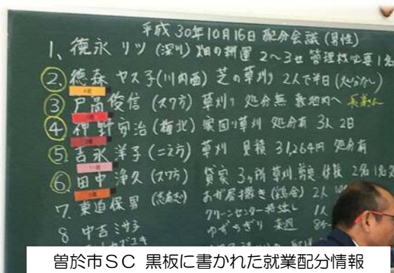
曾於市SC 黒板に書かれた就業配分情報