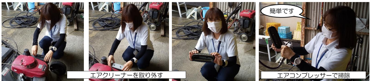
エアクリーナーを取り外す

エアクリーナーが詰まると、空気を取入れられないため混合気が濃くなり燃費が悪くなります。また、燃焼も悪くなり出力低下が起り、エンジンが本来の性能を発揮できなくなります。プラグも汚れ、しまいにはエンジンが始動しなくなります。これらを回避するため、芝刈り機使用後はエアクリーナーの掃除をお願いします。