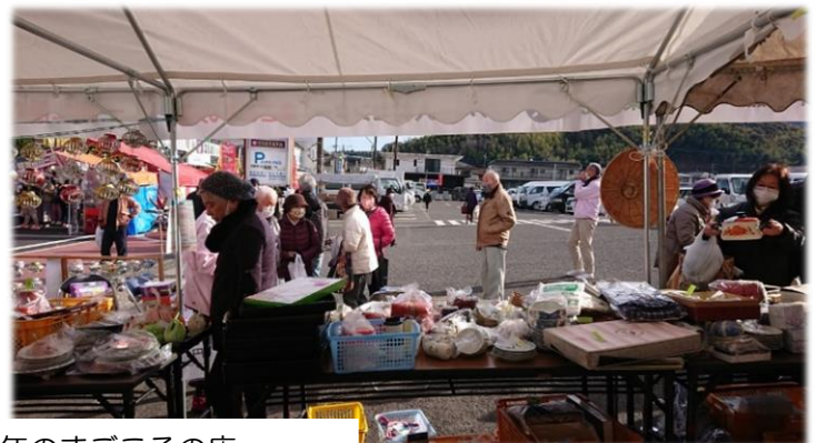
販った今年のまごころの店