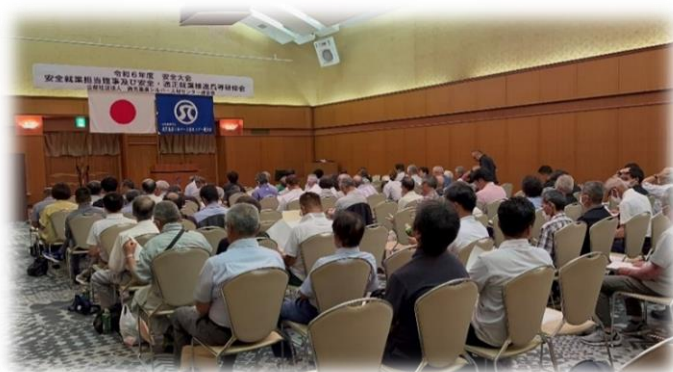
(上) 大会会場に集結した県下31拠点のシルバー関係者