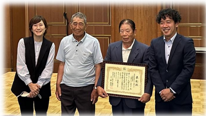
(下) 安全就業優良センターの表彰を受けた大崎SCのみなさん

大崎町SCの令和5年度における事故発生件数は驚異の0件です。月に2回実施している安全パトロールで会員の安全意識が高まっているとの事でした。